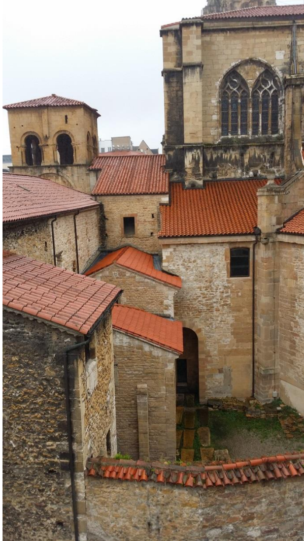
Fig. 4. Catedral de Oviedo. Vista del exterior del transepto sur desde el este, con la torre vieja (al fondo, a la izquierda), el muro norte del claustro, la Cámara Santa y la cerca del llamado “cementerio de peregrinos”, que separa el conjunto del monasterio de San Vicente.

Las tres capillas eran las dedicadas a los Santos Bartolomé y Simón, a San Judas y a San Andrés –siguiendo la interpretación de Francisco Javier Fernández Conde–, 33 que pasaban a ser englobadas en la nueva. Eran limítrofes a la capilla mayor por el norte y a la portada de camino al palacio episcopal por el sur (fig. 4).