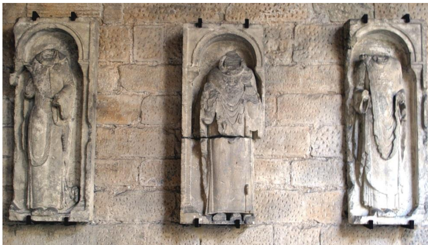
Fig. 3. Catedral de Oviedo. Relieves procedentes de los machones angulares del claustro románico.

Desde una perspectiva institucional y por razones de uso, la obra estaba en consonancia con las reformas emprendidas en la estructura del cabildo catedralicio por el obispo Pelayo de Oviedo entre los siglos XI y XII. Sus razones eran las de habilitar un lugar de residencia para el clero capitular bajo regla, con las oficinas necesarias para una vida comunitaria. Respecto a su importante colección de material constructivo, destaca muy especialmente el grupo de placas con relieves de personajes en posición frontal, bajo arquerías, procedentes con certeza de los machones angulares del claustro. Las divergencias estilísticas de este conjunto de relieves revelan un proceso constructivo dilatado, quizás en dos fases asociadas a las placas representando a santos que, además, conectaban el claustro románico de la catedral de Oviedo a un conjunto de claustros en el occidente peninsular caracterizados por contar con imágenes esculpidas o pintadas –santos y apóstoles de cuerpo entero y bajo arquerías– en sus machones. 8 Las placas en cuestión estaban marcadas por dos manos dispares, las más antiguas eran las halladas por Fernández Buelta (fig. 3), fechables en la primera fase del claustro, y las más tardías las tardorrománicas representando a san Pedro y san Pablo, que fueron reubicadas sobre la puerta del capítulo durante la reconstrucción gótica de las arquerías del patio, entre los siglos XIV y XV.