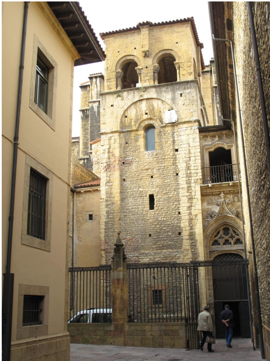
Fig. 1. Catedral de Oviedo. Vista de la fachada sur de la torre vieja.

que se abrió un gran ventanal neorrománico bajo la primera línea de imposta del cuerpo alto, el cual uniformizaba la fachada sur del campanario con sus tres lados restantes.